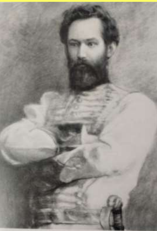
E- 2/ 8 - 54