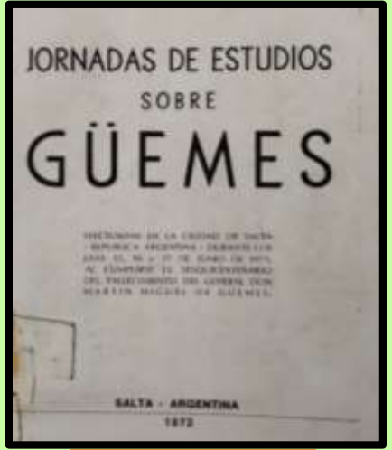
E- 4/ 4 - 51

Material bibliográfico disponible para su consulta en Biblioteca. Solicitar por los códigos que figuran debajo de cada imagen.