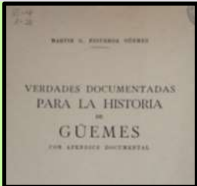
E- 4/ 1 - 21